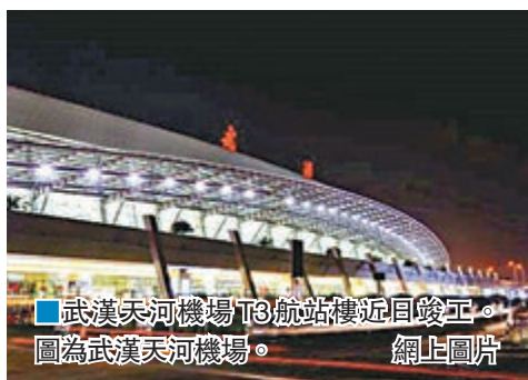
武漢天河機場T3航站樓近日竣工。圖為武漢天河機場。

香港文匯報訊(記者 俞鯤、通訊員 杜紅霞 武漢報道)湖北武漢天河機場三期工程核心項目T3航站樓近日通過竣工驗收。