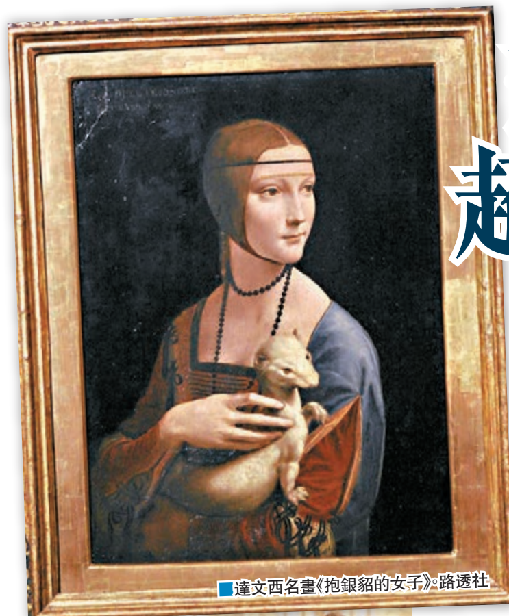
達文西名畫《抱銀貂的女子》。