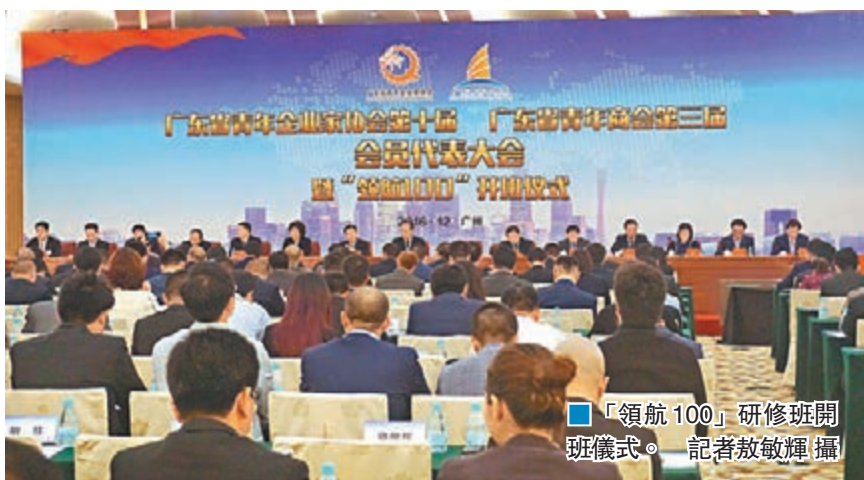
「領航100」研修班開班儀式。

香港文匯報訊(記者 敖敏輝 廣州報道)為了培養廣東大型骨幹企業後備軍，廣東將給有潛力的青年領軍企業提供系列扶持措施。記者近日獲悉，廣東省委、財政廳、省金融辦、經信委等11個政府部門聯合推出「領航100」實力提升計劃，通過整合資源，對年營業額在1億元(人民幣，下同)以上的青年企業，在政策扶持、素質提升、人才支撐和投融資服務等方面提供專項服務，助力其成長為百億級別骨幹企業。