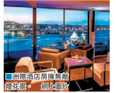
洲際酒店房擁無敵煙花景。

遊客湧悉尼 靚景房租飆至1.9萬 悉尼將於大除夕上演歷來最大規模煙花匯演，悉尼港沿岸酒店房間需求大增，房租急漲。擁有無敵煙花景的洲際酒店客房，除夕晚房價飆至2,500美元(約1.94萬港元)，坐落悉尼歌劇院與悉尼灣大橋之間的柏悅酒店也索價2,200美元(約1.7萬港元)。 大量遊客湧至悉尼，當地一房難求，即使無景觀可言的三星級酒店房間，租金也要700美元(約5,429港元)。在Airbnb網站出租房間的屋主也趁機大賺一筆，一個位處市郊柯里比利的單位，一晚租金為1,612美元(約1.25萬港元)。 如果不想入住酒店或租屋，坐落悉尼灣的遊艇是另一選擇，但當然絕不便宜，一艘可載12人的遊艇，每人平均收費約1,943美元(約1.5萬港元)。 ■《每日郵報》