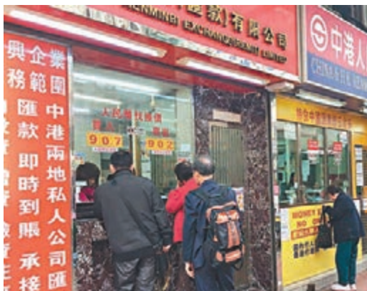
■離岸人民幣兌港元昨跌穿9算。

香港文匯報訊（記者 歐陽偉昉）離岸人民幣兌美元匯率昨刷新歷史新低，CNH昨在早上10時44分報6.987；離岸人民幣兌每百港元同時跌穿9算，報90.07。匯價創低位後急彈，惟午市再度向下，離岸人民幣兌港元幾乎再觸及早上低位，終在晚上7時附近回升。截至晚上7:15，CNH報6.9752，比上日跌24點，每百港元兌離岸人民幣報89.94。