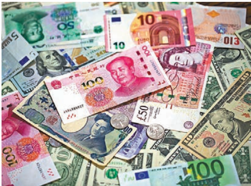
■明年1月1日起，CFETS貨幣籃子新增11種2016年掛牌人民幣對外匯交易幣種。

香港文匯報訊（記者 海巖 北京報道）中國央行直屬機構中國外匯交易中心昨發佈公告稱，明年1月1日起，CFETS貨幣籃子新增11種2016年掛牌人民幣對外匯交易幣種，CFETS籃子貨幣數量由13種變為24種，其中美元權重由26.4%調整為22.4%，下調4個百分點，下降幅度為15.15%。專家預計，未來按國家貿易投資加權的編制方式對籃子貨幣進行調整，美元權重會逐年降低，首次調整後美元權重微降，對於減輕當前人民幣貶值壓力的作用不大，需繼續加快人民幣匯率機制改革。