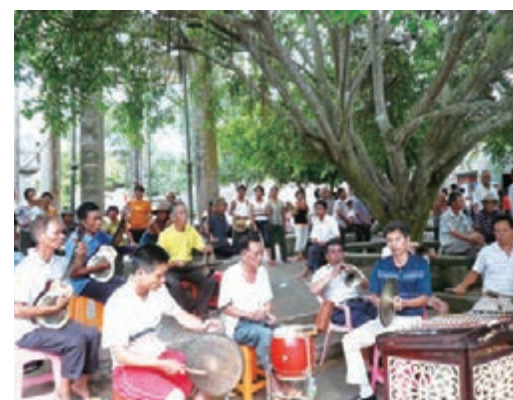
■海南八音器樂演奏