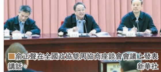
俞正聲在全國政協雙周協商座談會會議上發表講話。