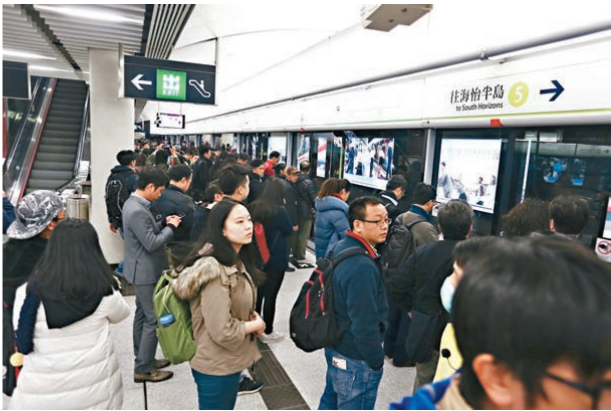
■昨日下午班時間金鐘南港島線月台人流暢旺，未見有「迫爆」情況。