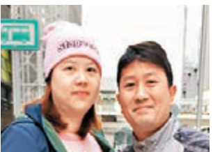
■葉先生與葉太太