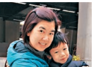
■林太太與兒子