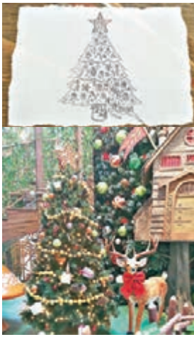
■喬漢娜特別為又一城獨家設計的聖誕插畫

雖然聖誕節剛過去，但不少商場的佈置會持續至明年1月1日或2日，所以如大家之前還未有空遊覽的話，不妨趁今個星期最後機會，既可感受藝術氣息，亦可大玩今年大熱的VR遊戲，來個不一樣的除夕及元旦。