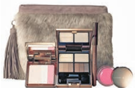
■Party Coffret 2016聖誕彩妝組合

今年冬天，LUNASOL為你呈獻時尚中展現素顏感、型格中更見成熟美的妝容。冷艷的灰色調中，散發出與別不同的金色閃亮柔光，是派對季節必然的淨化妝容，配上全新冬日限量Party Coffret 2016聖誕彩妝組合、限量的雙色眼影組、眼線筆、唇彩、唇膏、胭脂及新色甲油，以瑰麗金色的閃亮感，塑造精緻與洗滌心靈的淨化妝容。大家可以運用色調與閃亮光感的微妙變化，打造出精緻迷人的妝容，來體驗冬日淨化妝容為你帶來型格、成熟、魅惑的妝容。在眼影上，你可先用指尖於整個眼瞼塗上Light Nuance Color，然後用大眼影棒，由眼線開始向眼窩位置塗上Gold Nuance Color，最後用小眼影棒於眼線位置塗上Shade Color。