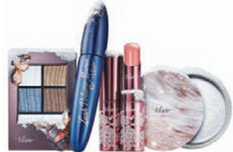
■Visée 2016 Holiday系列