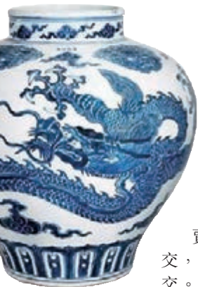
佳士得春拍億元拍品：明宣德青花五爪雲龍紋大罐

今年上半年香港的中國藝術品春拍剛舉槌，就漸入佳境有好的開頭，成交的億元重器還挺多的。譬如吳冠中的《周莊》拍得2.36億元、崔如琢的《飛雪伴春》拍得3.068億元、張大千的《桃源圖》錄得2.7億元成交，連續3天拍出3件超過兩億的拍品。