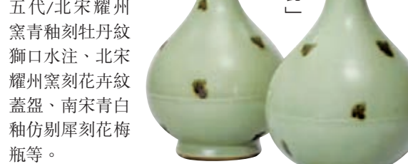
宋「飛青瓷」龍泉蒜頭瓶

老窯高古瓷今年備受青睞，推出市場也特別多，是全年拍賣市場的一個重要特點。今年最後一波優質老窯——香港佳士得秋拍焦點的「養德堂珍藏中國古陶瓷」專拍，單場總成交逾2,600萬元，焦點拍品「飛青瓷」龍泉蒜頭瓶以1,206萬元成交。此對「飛青瓷」瓶形典雅，釉水厚潤，周身飾褐斑19個，排佈得當，繁而不亂，獨具妙趣，「飛青瓷」數量稀少，歷來為鑒藏家所珍視，成對保存更是絕無僅有。當下內地老窯收藏蔚然成風，此對「飛青瓷」拍得好價自然是眾望所歸。該場的其餘高古瓷也有不錯的表現：北宋/金鈞窯天青釉紫斑大鉢、南宋吉州窯木葉盞、五代/北宋耀州窯青釉刻牡丹紋耀州窯刻花并紋蓋盃、南宋青白釉仿剔犀刻花梅瓶等。