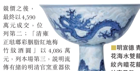
明宣德 青花海水雙龍紋內暗花龍紋高足盤

此次專拍明清官窯瓷器備受推崇，預展中就受一眾買家矚目的「明宣德青花海水雙龍紋內暗花龍紋高足盤」，以6,000萬元落槌，成交價6,886萬元冠絕全場，據悉，喜獲此名瓷為一名香港知名藏家以電話競投；另一件「清雍正青花喜上眉梢抱月瓶」在經數輪