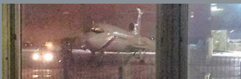
■俄國電視台攝影師在索契機場拍得失事客機最後照片。