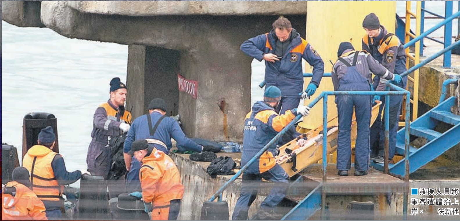
■救援人員將乘客遺體抬上岸。