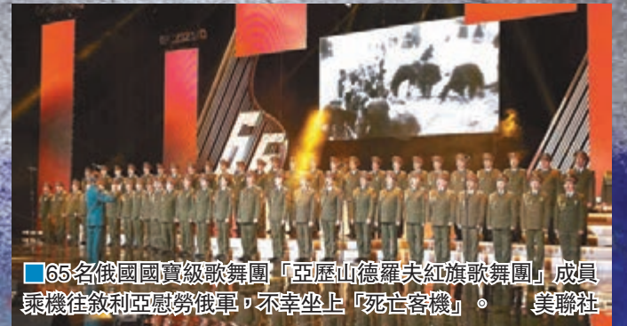
■65名俄國國寶級歌舞團「亞歷山德羅夫紅旗歌舞團」成員乘機往敘利亞慰勞俄軍，不幸坐上「死亡客機」。