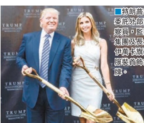
■特朗普或委託外部監察員，監察集團及長女伊萬卡旗下服裝首飾品牌。

「特朗普基金會」在1988年成立，宗旨是捐助兒童、退伍軍人及執法人員。《華盛頓郵報》今年6月報道，特朗普雖然承諾向基金會注資100萬美元(約775萬港元)，把善款撥捐一個非牟利退伍軍人組織，但他實際上只捐出部分金額，在公眾壓力下才全數捐出。另外，監察網站GuideStar去年公開一份稅單，顯示基金會去年及多年前曾多次涉嫌違法動用資金。 ■路透社/美聯社/《紐約時報》