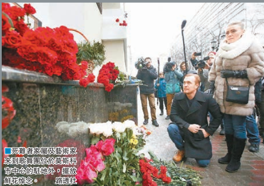
■死難者家屬及藝術家來到歌舞團位於莫斯科市中心的駐地外，擺放鮮花悼念。