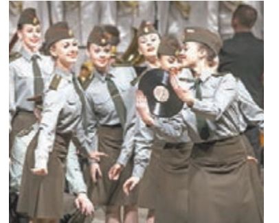
■「亞歷山德羅夫紅旗歌舞團」在開。

中國國家主席習近平及夫人彭麗媛2013年訪俄期間，本身是歌唱家的彭麗媛安排參觀紅旗歌舞團，與藝術家親善交流。團長馬列夫憶述，彭麗媛能唱俄語歌曲，而且唱得很好，隨後兩人更同台用中俄雙語合唱《紅梅花兒開》。 ■俄羅斯衛星網 去年新年期間到中國巡迴表演。