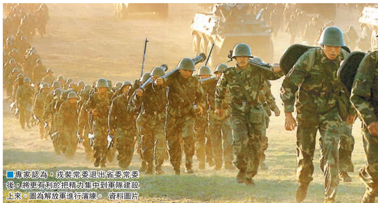
專家認為，戎裝常委退出省級黨委後，將更有利於把精力集中到軍隊建設上來。圖為解放軍進行演練。資料圖片

香港文匯報訊 綜合《法制晚報》、《中國國防報》、人民網報道，遼寧和雲南黨代會於23日閉幕，並選舉出了新一屆省委班子。至此，2016年已有14省區完成省級黨委換屆。據媒體梳理發現，14省份新一屆常委中均無軍方代表。加上尚未換屆的上海、天津、甘肅，無戎裝常委的省區市已達17個。國家行政學院教授許耀桐表示，戎裝常委退出後，將更有利於把精力集中到軍隊建設上來。