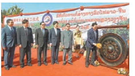
中老鐵路全線開工儀式在老撾北部瑯勃拉邦舉行。老撾總理通倫親自鳴鑼九響。

老撾公共工程與運輸部部長本占·辛塔馮說，老中鐵路項目是兩國全面戰略合作的歷史性里程碑，對發展老撾社會經濟具有重要意義，同時也將擴大和提升老中兩國在經濟、貿易、投資、旅遊等領域的合作，進一步增