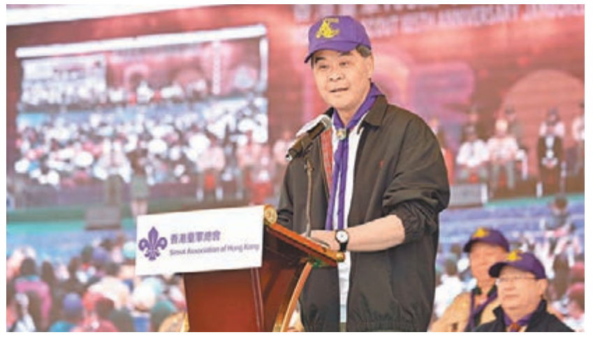
梁振英在香港童軍105周年紀念大露營開幕禮上致辭。

他最後預祝大露營圓滿成功,各位朋友滿載而歸。「很快就到新的一年,我祝在座所有朋友,新年進步,身體健康,生活愉快。」