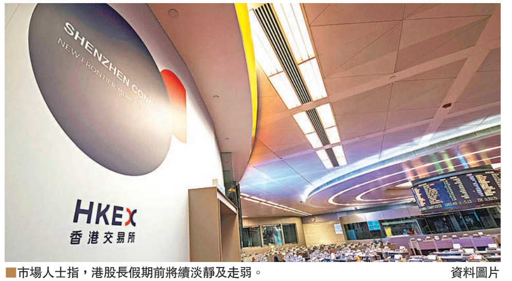
市場人士指, 港股長假期前將續淡靜及走弱。

據漢傳媒年報及聯交所資料, 藝人謝霆鋒持有漢傳媒15.8%股權, 經今次配股攤薄後, 他仍持有該股約10.9%股權。獲楊受成提全購刺激, 漢傳媒復牌後急升53.3%, 收報0.325元, 是升幅最大個股。