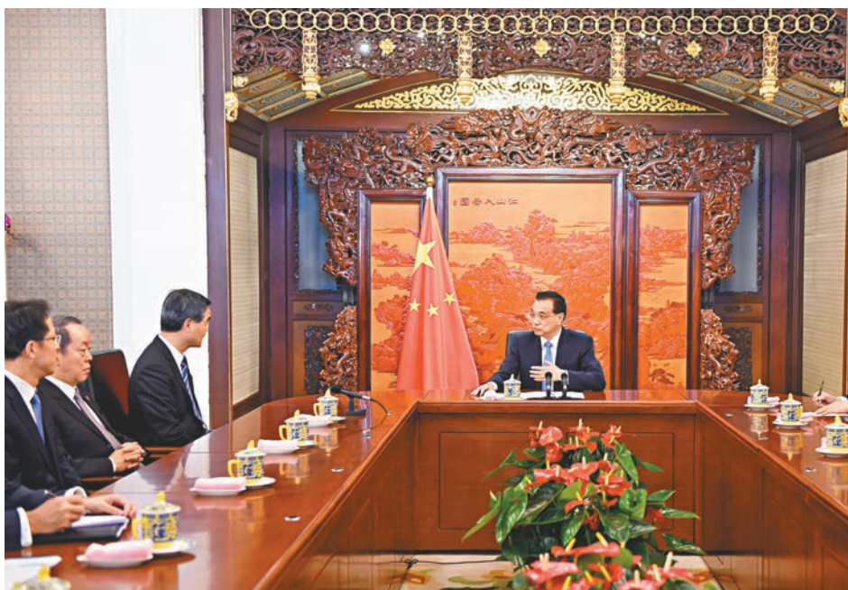
李克強聽取香港當前形勢和特區政府工作情況的匯報。