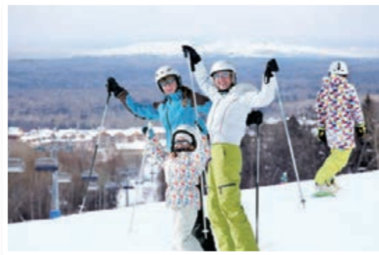
■萬達長白山滑雪場