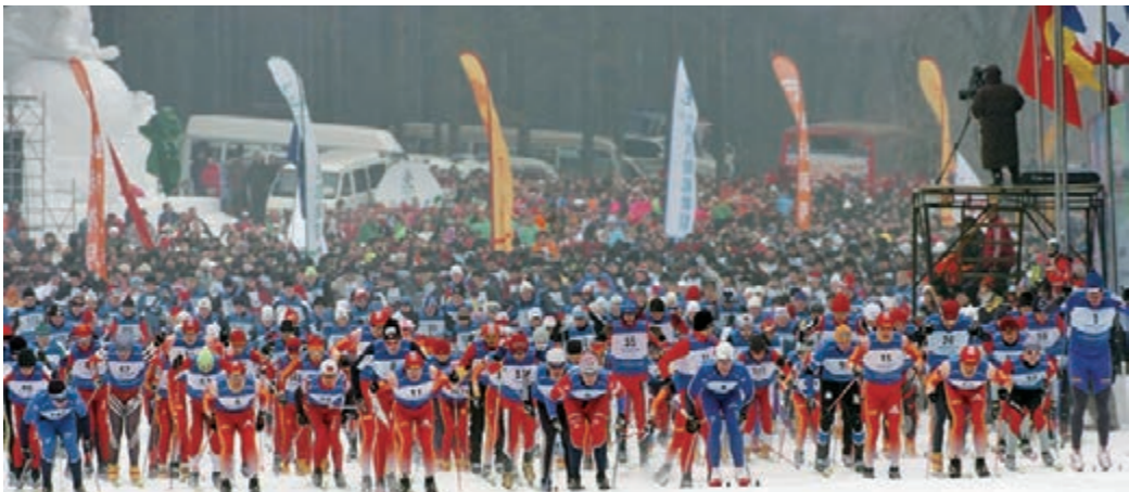
■冰雪旅遊節暨瓦薩滑雪節開幕式

觀雪、滑雪、漂流、冬捕、賞霧凇、泡溫泉，體驗濃郁的關東風情……來吉林省一站式全新體驗！