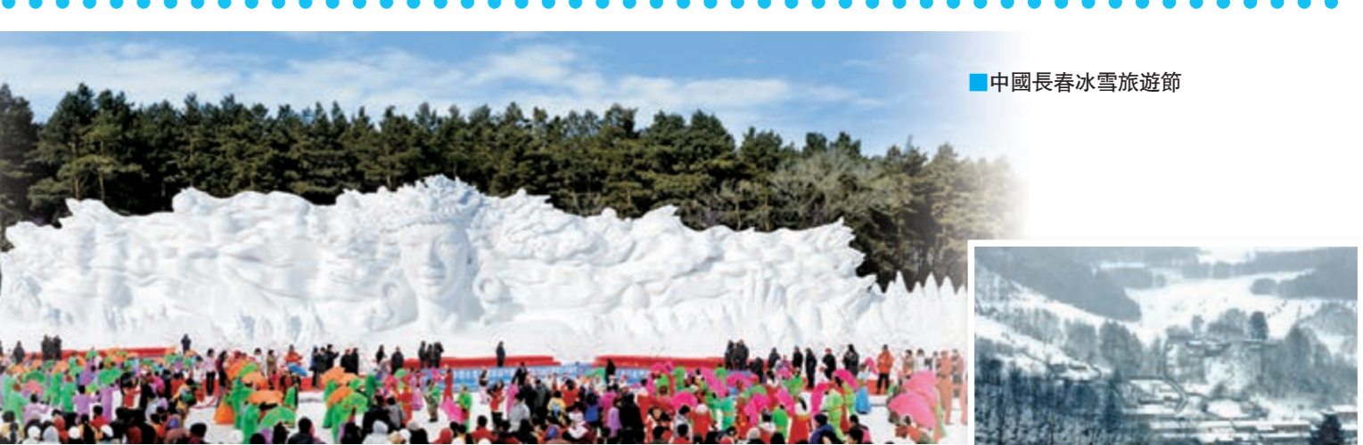
■中國長春冰雪旅遊節