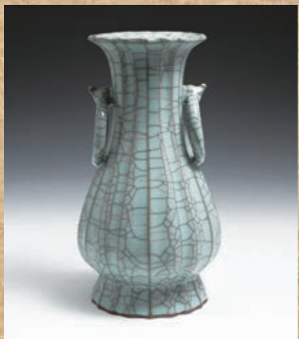
《吉祥百財》鐵胎哥窯