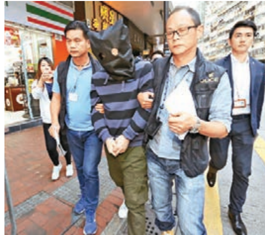
涉及兩宗強姦及非法禁錮案的男疑犯被押返藏匿的賓館搜證。

屯門警區重案組探員經追查後發現疑人逃脫後離開屯門區,匿藏於北角英皇道五洲大廈一間賓館內,昨午派員埋伏於附近街頭,待疑人現身即將其拘捕,稍後再押返賓館租住房間內搜查,檢走衣服、背囊等證物,疑人仍然被扣查。