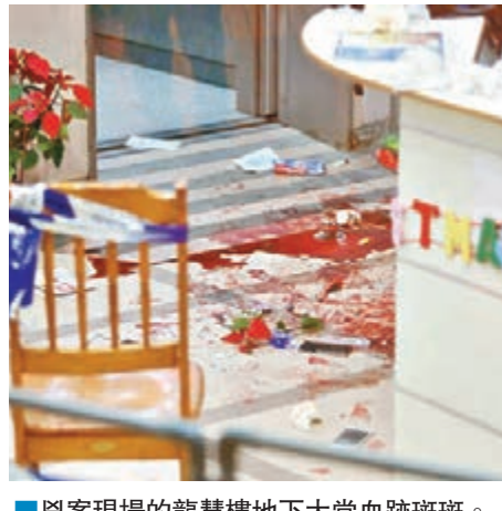
兇案現場的龍慧樓地下大堂血跡斑斑。

香港文匯報訊(記者 杜法祖)黃大仙下邨發生命案。昨晚7時許,一名男子在該邨龍慧樓地下大堂與一名男子爭執,現場消息稱,事主遭人用利剪插中右頸,疑傷及大動脈,當場血如泉湧重傷,兇徒傷人後逃去,救護車接報到場將傷者送往廣華醫院急救,惜抵院證實不治。警方列作謀殺案,封鎖現場調查血案起因,並追緝在逃兇犯歸案。