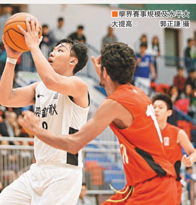
學界賽事規模及水平大大提高。