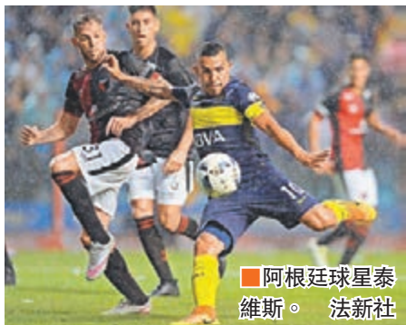
阿根廷球星泰維斯。

最近關於阿根廷球星泰維斯天價合約加盟中超上海申花一事被炒得沸沸揚揚。據知名媒體《ESPN》昨日得到的消息稱，泰維斯在申花的周薪為61.5萬英鎊，其年薪也將達到3198萬英鎊，這一年薪數字也將超過C