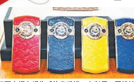
不少網友認為「故宮手機」有利用工匠精神的嫌疑。圖為「故宮手機」。

一家手機廠商聯合北京故宮文化傳播有限公司近日推出了一款手機。機身融合了團龍、祥雲等傳統圖案的手機每部售價19,999元人民幣，號稱全球限量999台，預計2017年1月底上市。不同於故宮以往幾次在文化產品上創新的好評如潮，不少網友認為「故宮手機」有利用工匠精神作秀的嫌疑。圖為「故宮手機」。