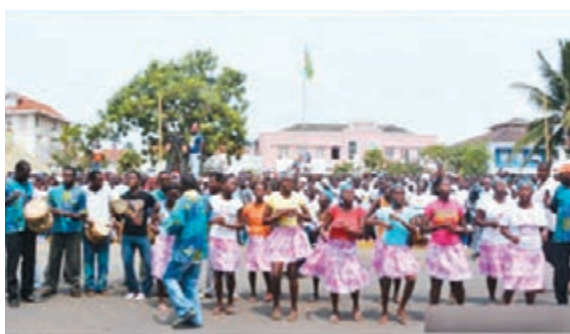
聖多美和普林西比政府在當地時間20日發表聲明，決定與台灣「斷交」。圖為首都聖多美。網上圖片

中國國民黨主席洪秀柱昨天表示遺憾，希望當局頭腦清楚一點及更有智慧。國民黨副主席胡志強說，骨牌式「斷交」會不會再發生，值得注意，不排除繼續發生的可能性。對於「斷交」後會否形成骨牌效應，政治大學外交系副教授黃奎博持肯定態度。他認為聖國宣佈「斷交」正值政黨輪替、兩岸關係變差之時，因此「力道也大得多」，後續可能出現骨牌效應。