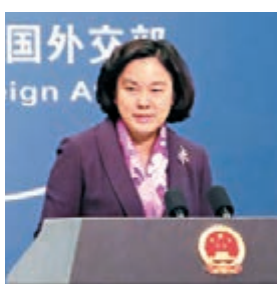
華春瑩表示以金錢援助換取聖國與台「斷交」的說法「很有想像力」。中央社