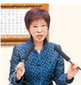
洪秀柱希望台當局頭腦清楚一點。