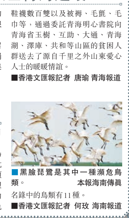
黑臉琵鷺是其中一種瀕危鳥類。

物種總數的34.2%，海南島鳥類目佔中國鳥類目的83.3%。在珍稀瀕危鳥類方面，海南島共有84種鳥被列入各種珍稀瀕危名錄中，其中國家重點保護鳥類77種，被列入世界自然保護聯盟IUCN瀕危及以上等級紅色名錄的鳥類有5種，被列入中國物種紅色