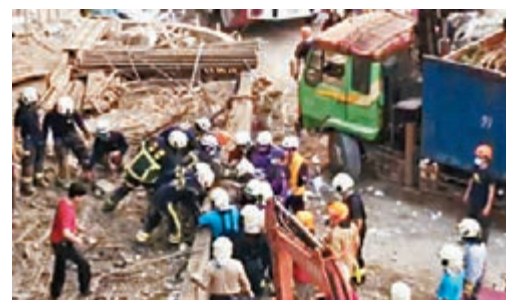
桃園市一間學校發生棚架倒塌意外，造成五人死亡。

現場工人表示，當時正在施工的大溪高中活動中心突然發出巨響，發現是棚架倒塌，但因素發突然，導致正在附近工作的工人逃避不及，被棚架壓住。桃園市「教育局」表示，校園高樓層有目擊棚架倒塌的班級，校方已請學生遠離現場，做好管制措施，並對學生進行團體輔導，後續工程校方及監造單位也將檢查是否符合工業安全規定。