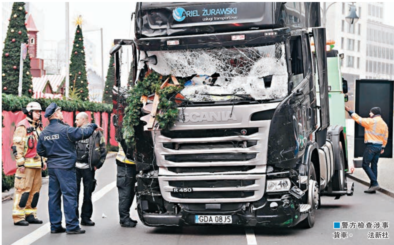
警方檢查涉事貨車。

德國內閣昨日通過草案，放寬對在公眾地方裝設閉路電視的限制，又讓警員執勤時佩戴隨身攝錄機，以加強當局的保安能力，以及進一步保護執勤警員。草案上月已獲總理默克爾領導的基督教民主聯盟原則上同意，但同時惹來民眾監視的憂慮。 ■法新社/美聯社/路透社/《每日郵報》