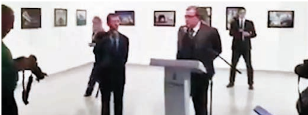
片段顯示阿爾廷塔斯試圖拔槍時猶豫。 網上圖片

殯，俄總統普京將原定今日舉行的年度記者會順延至明日，以出席卡爾洛夫的追悼儀式。俄、土及伊朗外長前日按原定計劃舉行三邊會談，商討敘利亞局勢，普京稱，行刺卡爾洛夫的動機是阻撓俄土為敘內戰尋求和平解決方案。 ■《每日郵報》/法新社