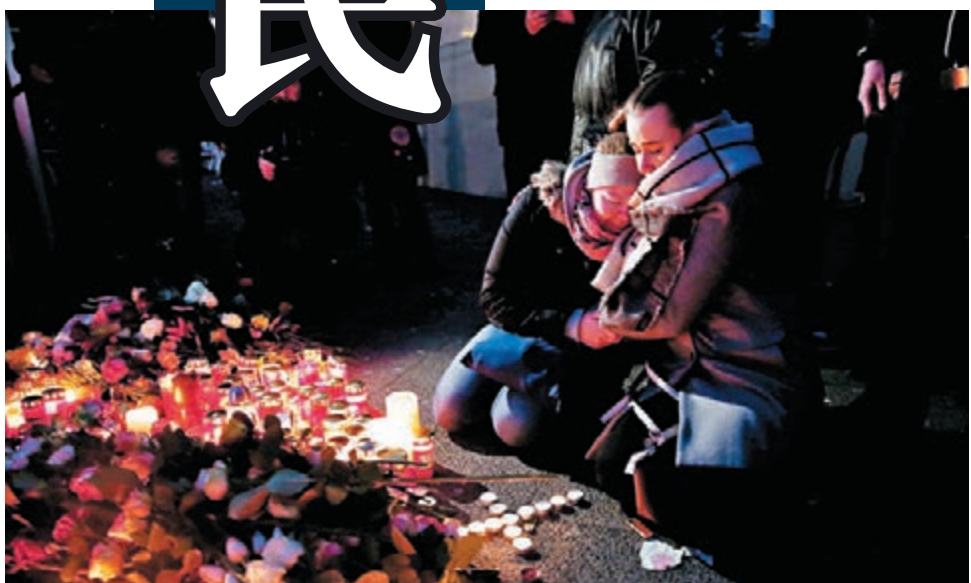
民眾燭光悼念死難者。

另一方面，奧地利維也納的「Sylvesterpfad」聖誕走廊是大受歡迎的除夕慶祝景點，為防範類似科隆的性侵犯事件，警方計劃向到來的女性派發小型防狼警報器。 ■霍士新聞台