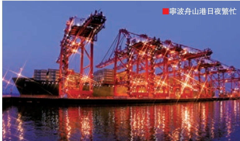
寧波舟山港日夜繁忙

隨著停泊在寧波北侖第二集裝箱碼頭的「中海釜山」輪完成2,500標準箱裝卸作業，19日，寧波舟山港年貨物吞吐量突破9億噸。據統計，1至11月份，寧波舟山港集裝箱吞吐量增幅居全球前六大集裝箱港口首位。