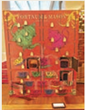
你可以每天開一格，直至聖誕來臨。

當中精選各款充滿心思的佳節禮物，如時尚系列單品、美容產品、生活精品及聖誕裝飾物，讓大家無論親臨店內或於網上店購物，都可從產品背後精彩故事，感受到設計師的熱情與創意。