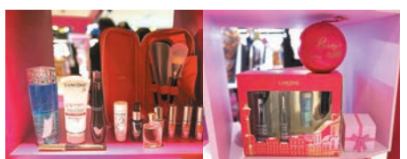
聖誕限量彩妝系列