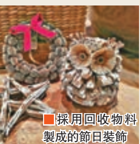
採用回收物料製成的節日裝飾

一向以環保來號召的TREE，在普天同慶的聖誕節將至，是時候利用時尚環保的聖誕裝飾物佈置家居，讓眾人陶醉於歡愉浪漫的節日氛圍之中。這些節日裝飾採用回收物料製成，每一件均由東南亞工匠人手製作，當中包括帆布聖誕老人擺設，除了可作為贈給親友的小心意，更可作名片夾之用，同時還有圓點帆布小雪人及錫樹擺設，把它們並列在桌面上，為聖誕揭開序幕。