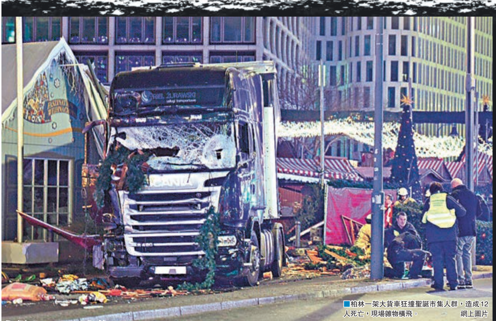
柏林一架大貨車狂撞聖誕市集人群，造成12人死亡，現場雜物橫飛。