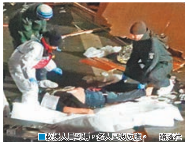
救援人員到場，多人已沒反應。