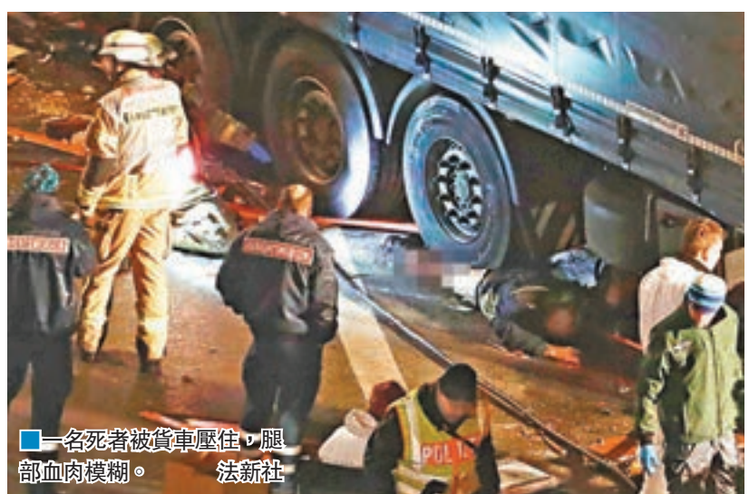
一名死者被貨車壓住，腿部血肉模糊。