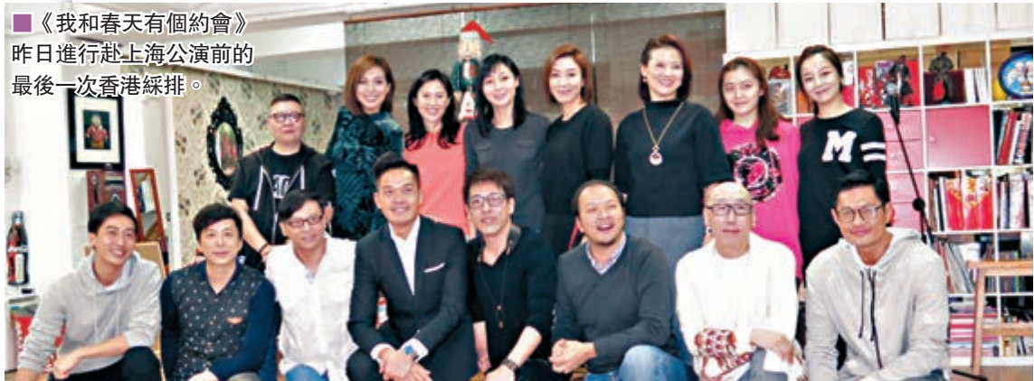
《我和春天有個約會》昨日進行赴上海公演前的最後一次香港綵排。