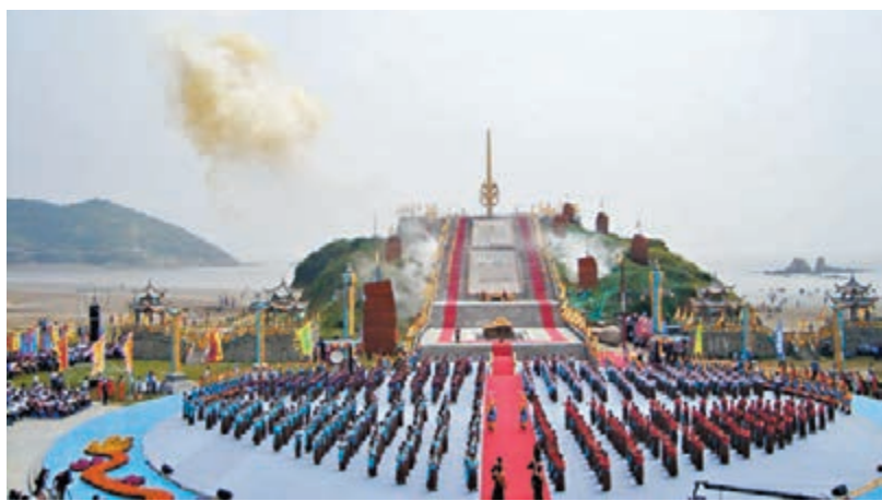
岱山海壇是中國首個大型祭海壇。網上圖片。九天星斗三更落，照遍珊瑚海上洲。（劉夢蘭詩）的壯觀場景。徹夜不眠的漁港，場面催人想像。

東沙古鎮，中國海洋漁業博物館，講解員為我們描繪了數百年前，古鎮漁民的極度繁華。宋元時期，岱山漁場就是「樓櫓萬艘」（蘇東坡詩），「千家食大魚」（沈夢麟詩），到了清朝，則出現「無數漁船一港收，漁燈點點