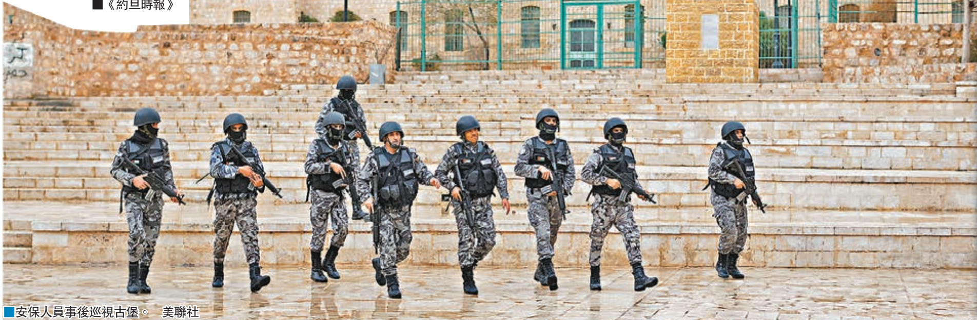
安保人員事後巡視古堡。