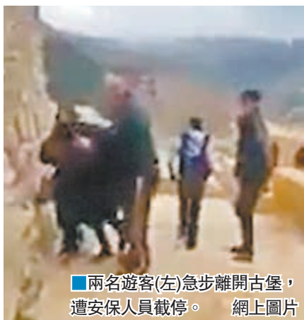
兩名遊客(左)急步離開古堡，遭安保人員截停。

自從美國主導的聯軍展開ISIS打擊行動以來，約旦一直積極參與，頻頻空襲鄰國敘利亞及伊拉克的ISIS據點，又開放基地予聯軍成員國使用，這令約旦更易成為恐襲目標。今年6月，6名在接壤敘利亞邊境的安保人員遭自殺式炸彈炸死。2014年12月，約旦一架戰機於敘利亞邊境墜落，機師卡薩斯巴被ISIS俘虜，更在鐵籠內遭活活燒死。今次發生槍擊案的城市卡拉克，正是卡薩斯巴的家鄉。很多約旦人也反對加入聯軍，認為這是殺戮穆斯林，並導致國家安保受威脅。