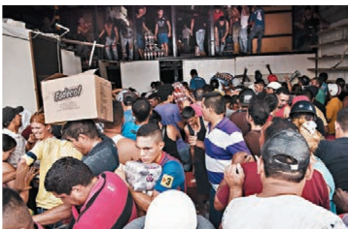
委國民衆闖入貨倉搶走物資。

「搶錢」事件持續至前日早上，數十家華人商店遭殃。中國駐委內瑞拉大使館在騷亂發生後，馬上啟動應急預案，要求當局採取措