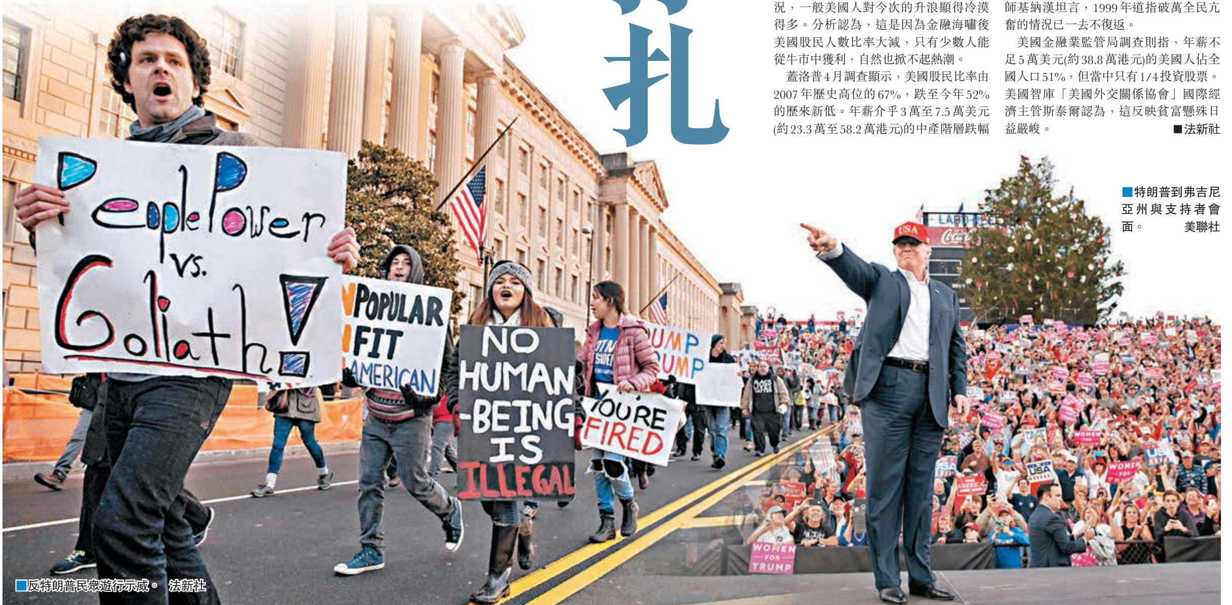
反特朗普民衆遊行示威。法新社

美國金融業監管局調查則指，年薪不足5萬美元(約38.8萬港元)的美國人佔全國人口51%，但當中只有1/4投資股票。美國智庫「美國外交關係協會」國際經濟主管斯泰爾認為，這反映貧富懸殊日益嚴峻。 ■法新社