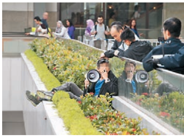
政總天橋懷疑企跳男子。

警方封鎖現場調查，用帳篷覆蓋老翁屍體，並向肇事陳姓的士司機及21歲鄭姓私家車司機調查事發經過。稍後的士司機因涉嫌「危險駕駛引致他人死亡」被捕，帶署扣查。 警方仍在追查連環撞老翁身份，以及了解其因何會在深夜時分在馬路中央行走。 案件已由西九龍總區交通部特別調查隊跟進，警方呼籲任何人如認識死者、目睹意外發生或有任何資料提供，請致電3661 9000或3661 9058與調查人員聯絡。