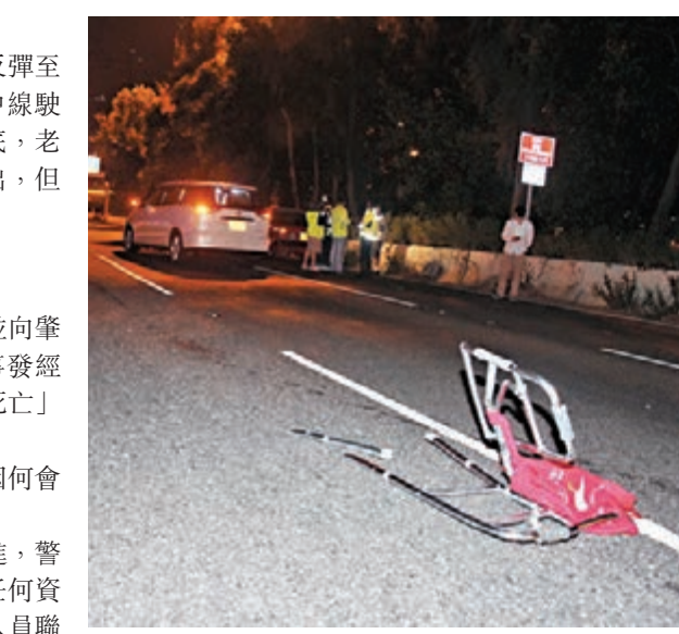
老翁的助行架亦撞至損毀遺在路中。