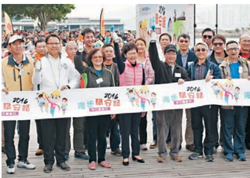
工聯職安健協會昨日舉行「漫步職安路」籌款活動,有逾千人參加,籌得近百萬元的善款為工傷個案提供經濟援助。

香港文匯報訊(記者 翁麗娜)工業意外一宗都嫌多。工聯職安健協會昨日舉行「漫步職安路」籌款活動,有逾千人參加,籌得近百萬元的善款為工傷個案提供經濟援助。政務司司長林鄭月娥出席活動致辭時表示,特區政府重視僱員工作安全,透過立法、執法及教育等多管齊下,加上僱主、僱員和業界組織的努力,過去十年社會職安健意識有顯著改善,去年職業傷亡個案約3.58萬宗,較2006年約4.69萬宗減少24%。 昨日是周日,一眾打工仔難得休息,但為做善事不介意早起齊集觀塘海濱公園,再步行至啟德郵輪碼頭,身體力行參與籌款活動,不少人更帶同子女到場,一起認識職安健的重要性。活動邀請政務司司長林鄭月娥、勞工處處長陳嘉信、工聯職安健協會主席林淑儀、工聯會榮譽會長鄭耀棠,及中原慈善基金主席黃偉雄出席擔任主禮嘉賓。 林鄭月娥致辭時表示,過去十年,職業意外每名傷亡率由2006年的18人,下降至2015年的