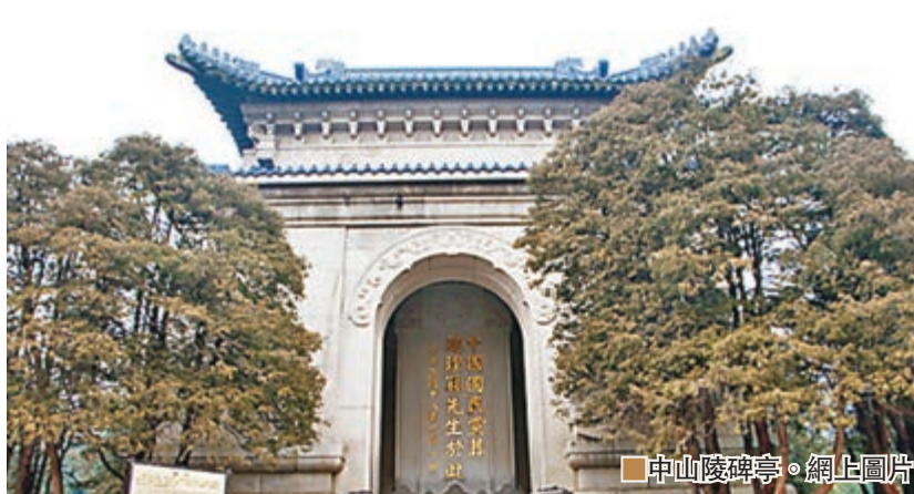
中山陵陵墓亭。

1925年3月12日，長年超負荷工作的孫中山因肝癌在北京去世，彌留之際，他仍不忘南京和紫金山。一天，國民黨要員汪精衛、張靜江、何香凝等到孫中山寓所探望，悄聲與宋慶齡、孫科等家人提起孫先生後事，宋慶齡早已泣不成聲。信奉風水的汪精衛振振有辭道，孫總理乃明崇禎皇帝後身，一旦山陵崩，宜葬景山為妙。景山是北京城中軸線上、故宮北側的皇家園林，崇禎帝於清兵入京時上吊於此。不料汪精衛此言竟被昏睡中的孫先生聽到，他在病榻上側身道：「否！否！我欲葬紫金山！」在場人頓時面面相覷一片愕然，不知這紫金山所指何處？只好上前安慰先生，連聲應允。中山先生逝世後，國民黨上層聚