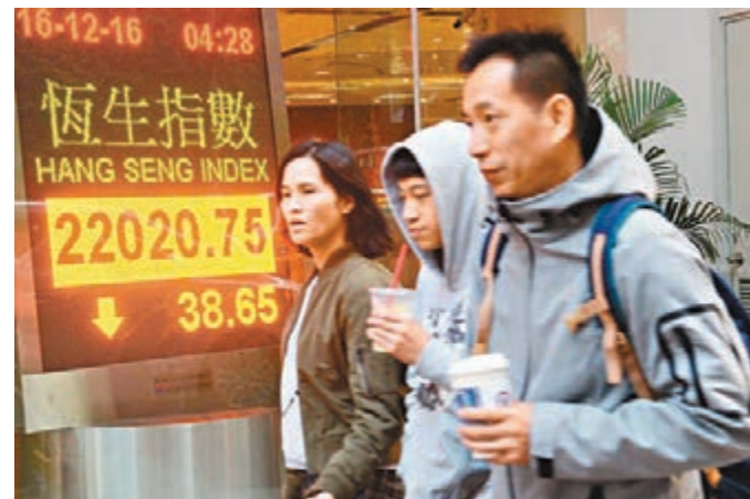
■ 港股昨跌38點,22,000關口失而復得,成交回落至720億元。全周計,港股跌740點。

香港文匯報訊(記者 周紹基)美國加息塵埃落定,基金經理也開始放假,大市轉趨悶局。港股昨曾經跌穿22,000點,跌至八月初最低水平,其後市況一度止跌回升,最多升過95點,但尾市又再下跌,全日跌38點報22,020點,成交回落至720億元。全周計,港股大跌740點,是六月中以來最大單周跌幅。券商指,臨近聖誕假期,資金入市意慾不足,大盤股疲軟居多,投資者料會轉炒三四線股。