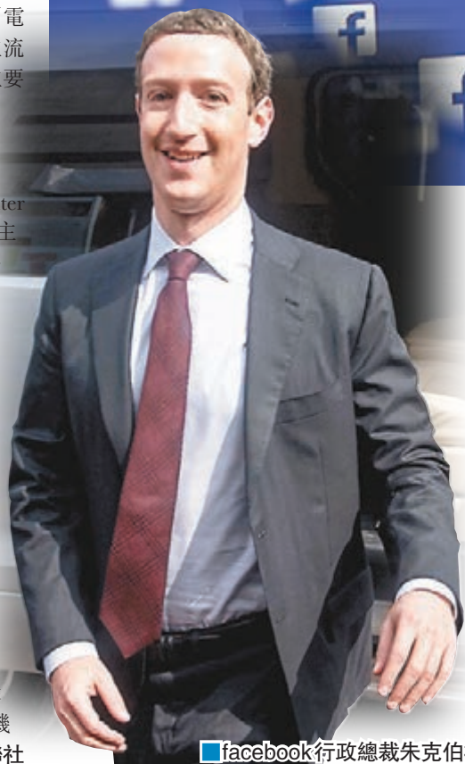
facebook行政總裁朱克伯格