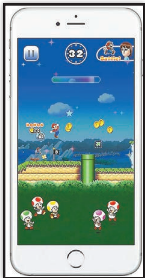
Super Mario Run為任天堂首隻「親生」手機遊戲。

任天堂首隻「親生」手機遊戲Super Mario Run(中文名「超級瑪利歐酷跑」)，昨日正式在蘋果iOS平台上推出，短短半日便登上App Store全美暢銷榜首位，並高踞全球68個地區下載榜榜首。不過任天堂股價卻逆勢而行，昨日收市大跌4.24%，市值蒸發約15億美元(約116.5億港元)，分析認為遊戲的9.99美元(香港為78港元)定價太高，加上沒有追加課金項目，長遠難為任天堂帶來可觀收入。