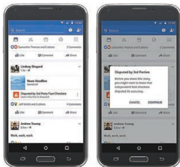
一旦證明失實，fb會顯示警告和核查連結。