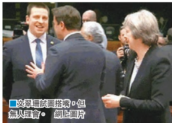
文翠珊試圖搭檔，但無人理會。