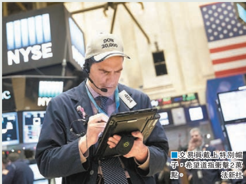
交易員戴上特別帽子，希望道指衝擊2萬點。

調整，問題是跌勢會持續多久。 特朗普承諾上台後減稅及增加基建開支，成為美股上升的主要動力，道指自特朗普勝選後累升超過8.5%，但牛市維持愈長時間，股市便變得愈脆弱。假如特朗普上任後遲遲不推出刺激經濟措施，投資者信心不穩，股市可能大幅回調。匯控外匯首席策略師布盧姆認為，投資者眼見市場升勢凌厲，紛紛入市，假如牛市告終，較遲入市的投資者會毫不猶疑離場。 ■哥倫比亞廣播公司/《華盛頓郵報》