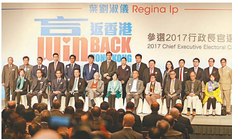
■葉劉淑儀昨日宣佈參加特首選舉。