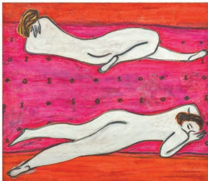
■常玉畫作《兩裸女》，經紅外線檢測會發現畫作下方人物左腳處還有一隻腳隱藏在下，佐證作品潛藏另一層繪畫層。