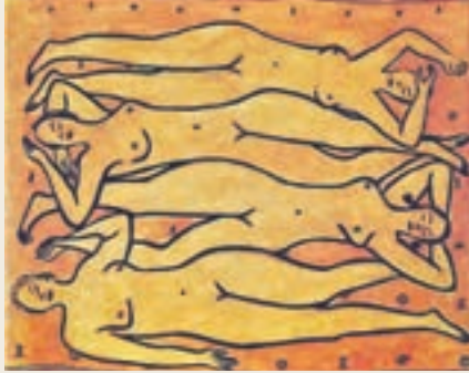
■台北史博館藏：《四裸女像》