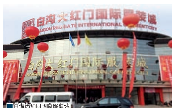
白溝大紅門國際服裝城

同時，在農行河北分行的支持下，白溝支行研究出台了單證抵押擔保管理辦法，解決商戶兩證不齊的融資難題，累計發放貸款2.46億元，支持小微企業67家。由於白溝市場農村商戶佔絕大多數，通過個人助貸款、農村個人生產經營貸款、個人住房按揭貸款、信用卡等產品，拓展「三農」服務對象，截至10月末，個人生產經營和助業貸款餘額9,318萬元，發放信用卡11,349張，發放個人住房按揭貸款4,981筆，近3年新投放12.14億元，佔當地銀行此項業務份額的73%。