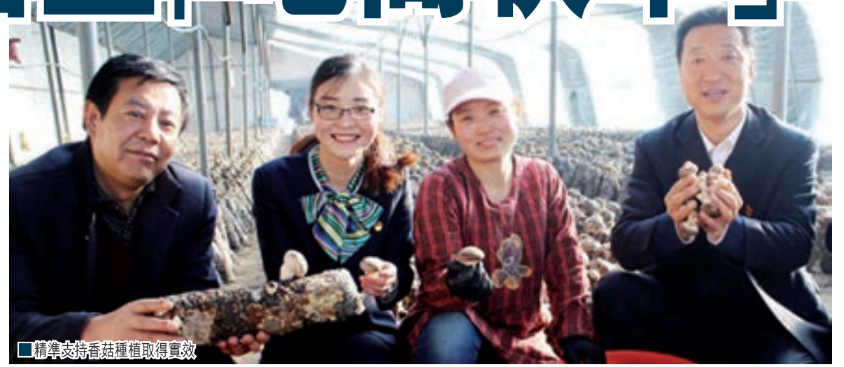
精準支持香菇種植取得實效