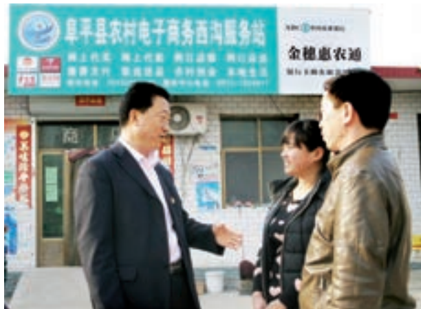
農行金穗惠農助農電商發展

「只要有信心，黃土變成金」這是中共中央總書記習近平去河北阜平縣看望貧困群眾時給他們的囑託。作為阜平縣唯一一家國有大型商業銀行，中國農業銀行把阜平列為了農總行全國定點扶貧縣，普惠金融與「特惠金融」雙輪驅動，把阜平156個「一村一店」電子商務服務站全部納入了農行「惠農通」助農取款服務點，為「農產品進城、工業品下鄉」提供了便利。截至目前該平台已綁定307戶下游渠道商戶，實現交易1,144筆、金額212萬元（人民幣，下同），讓阜平百姓搭上了「電商快車」。