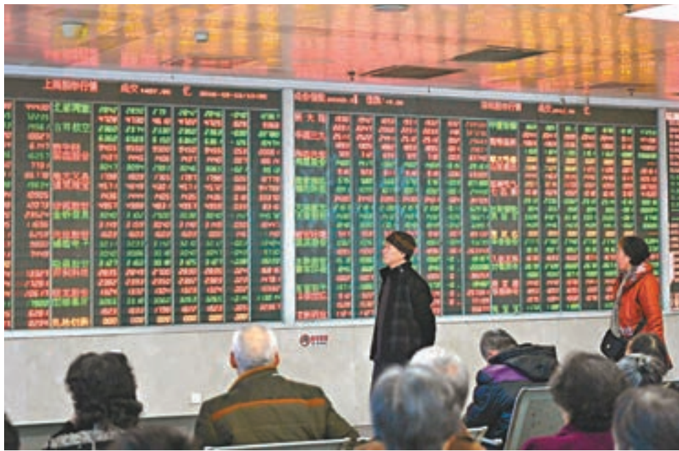
市場分析認為，在監管機構加大股市投機打擊力度後，保險資金大舉購股之舉將有所收斂。圖為成都某證券營業部內，股民關注大盤走勢。

經濟學家宋清輝則對本報提到，保監會強調加強監管，具有現實意義，險資低買高賣雖是市場行為，但助長了市場短線投機熱情，進而影響股市健康發展，不過險資謀求的是長期穩定收益，現階段的資產配置選擇空間並不是很多，在二級市場適當提高對業績穩定的大藍籌投資配置，於險資而言是大勢所趨。