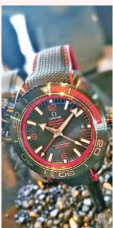
海馬 Planet Ocean 「Deep Black」系列