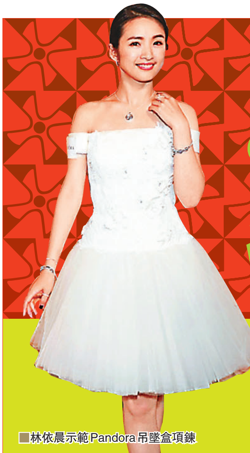
林依晨示範 Pandora 吊墜盒項鍊