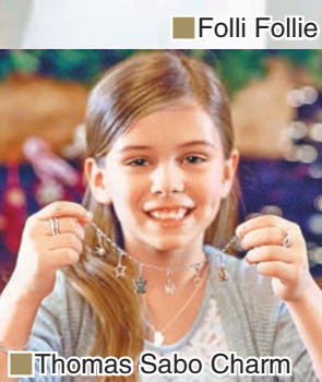
Thomas Sabo Charm