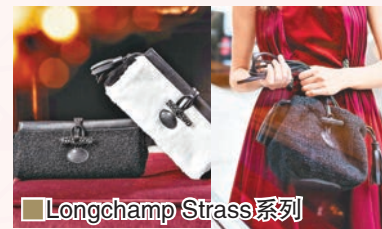
Longchamp Strass 系列

聖誕節步近，女士們的手袋隨即化身成聖誕童話，換上亮麗紅色羊皮，並以耀目金色皮作點綴，恍如女士手中尊貴珠寶。每到這個時候，Longchamp 都會推出每年一次的大熱聖誕限量版手袋系列「Strass」，一如以往，設計採用了品牌經典的竹節鈕扣，並特意鑲嵌 Swarovski 水晶。而系列中的兩款手袋——長方形的手拿包及小袋子上可調校的長肩帶，予你不同方式演繹獨有的「手袋戲法」。這兩款手袋有着三種不同的設計，並以高質的物料精心製作。金色皮革的袋面散發着絲綢般的亮麗光澤，為你的時尚造型勾畫出一道優雅動人的光芒。