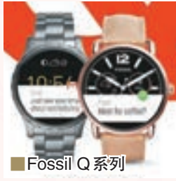
Fossil Q 系列