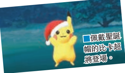
■佩戴聖誕帽的比卡超將登場。

離的精靈蛋，官方未有詳細解說，只表示未來數月內會有更多第二代精靈推出，鼓勵小精靈訓練員積極孵蛋。新精靈「不能捉，只能孵」，許多訓練員得知消息後大感失望，在官方社交平台表達不滿。 ■中央社