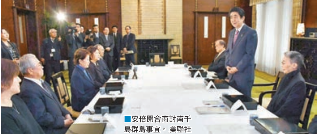
■安倍開會商討南千島群島事宜。