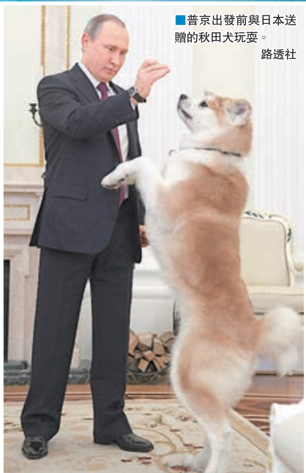
■普京出發前與日本送贈的秋田犬玩耍。