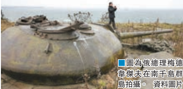
■圖為俄總理梅德韋傑夫在南千島群島拍攝。資料圖片