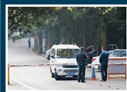
■黑車問題是廬山的頑疾之一。圖為黑車正在進入含鄱口景區。

當記者行至江西省廬山綜合執法局景區門票稽查隊門口時，工作人員在與導遊聊天。記者向前詢問180元門票可否遊遍廬山所有景點，工作人員給予否定。旁邊的導遊則說，可以帶記者遊覽有優惠。「有親戚（上山）來，我們去接，就可以免費。（工作人員和我們是）一個鎮上的，抓到了不要緊！」