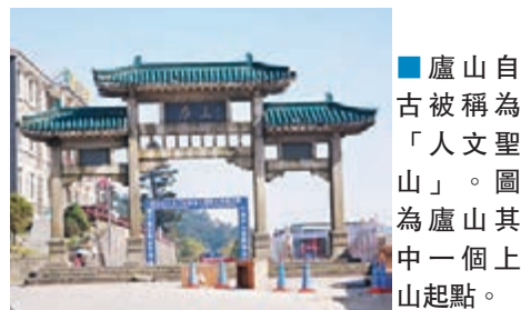
■廬山自古被稱為「人文聖山」。圖為廬山其中一個上山起點。

根據《國務院關於同意江西省調整九江市部分行政區劃的批覆》，2016年5月時江西省調整九江市部分行政區劃，撤銷星子縣，設立縣級廬山市，將九江市廬山區牯嶺鎮劃歸廬山市管轄。三百平方公里廬山風景區，有一大瀑布（廬山瀑布）、兩大峽谷（桃花源、棲賢谷）、三大名泉（天下第一泉谷簾