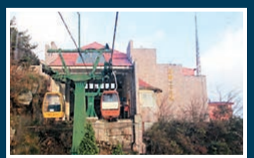
■濫收費是當地部門急需解決的問題。圖為含鄱口索道。