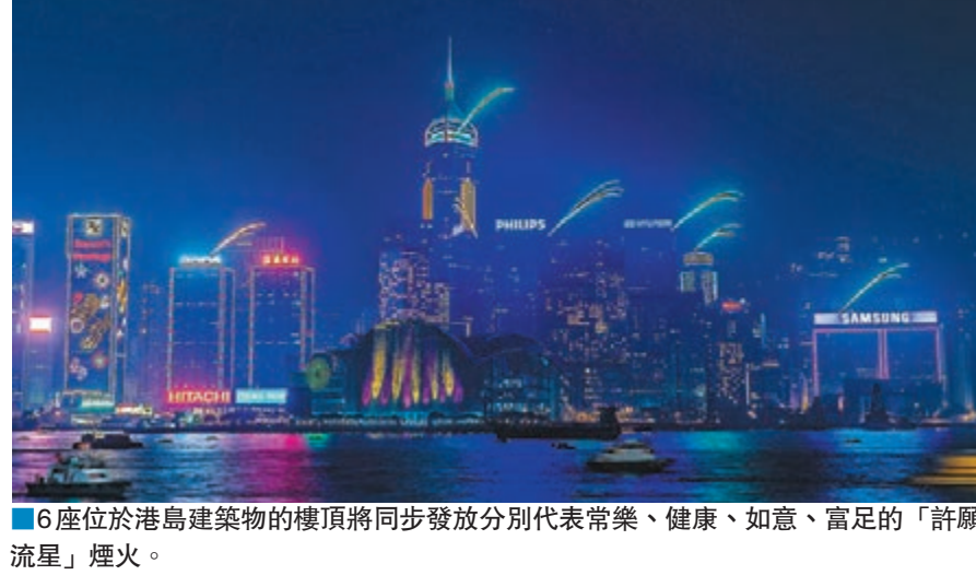
6座位於港島建築物的樓頂將同步發放分別代表常樂、健康、如意、富足的「許願流星」煙火。