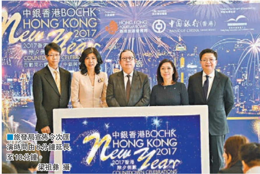
旅發局宣佈今次匯演時間由8分鐘延長至10分鐘。

公眾當晚可於港九多處觀賞匯演,至於最佳觀賞位置則包括尖沙咀海濱花園、香港文化中心露天廣場的沿海一帶、中環新海濱、中環9號和10號碼頭一帶及灣仔金紫荊廣場。為配合是項活動的舉行,中環、尖沙咀、灣仔多處在大除夕當晚,將分階段實施特別交通及運輸安排。維多利亞港中部將臨時禁止船隻航行,至於九龍公眾碼頭也會暫停使用。