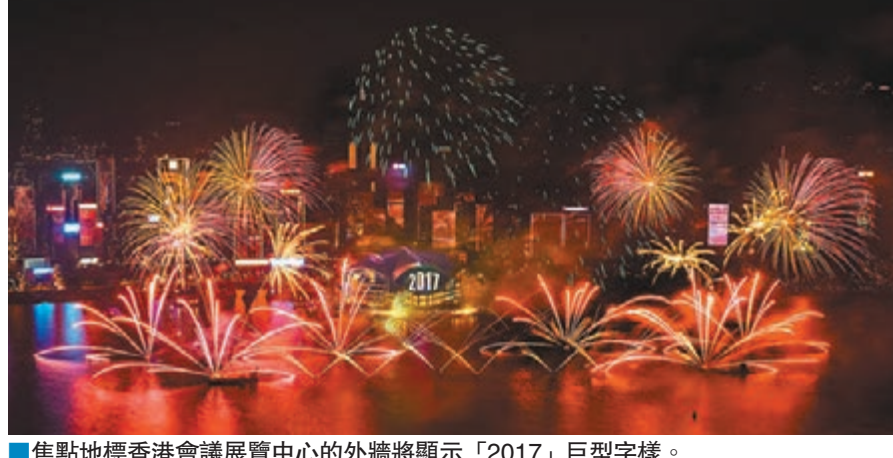
焦點地標香港會議展覽中心的外牆將顯示「2017」巨型字樣。