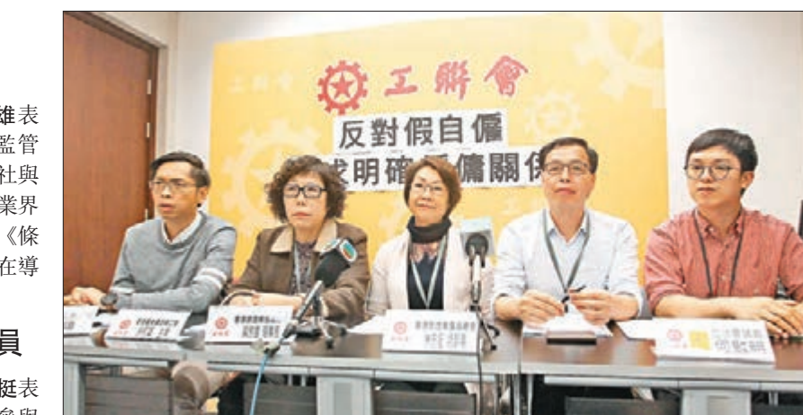
工聯會立法會議員及工會代表會見蘇錦樑後召開記者會。

日後旅遊業監管局委員的組合,他希望旅遊業議會透過在旅監局期間改變現有做法,不應忽視前線導遊及領隊的權益,也寄望日後成立的旅監局不應傾斜旅行社利益,導遊及領隊的代表應佔合理的比例,以平衡業界的聲音。