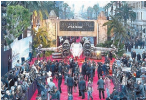
片中的X-Wing戰機更擺放在紅地毯上,相當有新社氣。