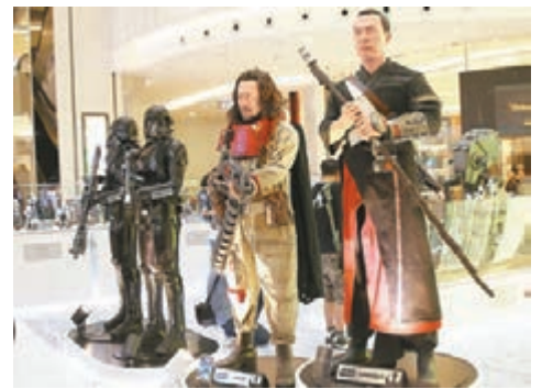
旺角新世紀廣場於全球首度展出甄子丹與姜文電影造型1比1比例雕像。