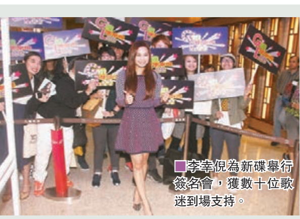
李幸倪為新碟舉行簽名會,獲數十位歌迷到場支持。