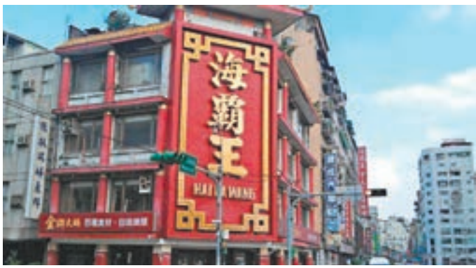
學者指海霸王與蔡割席，或在台企中產生骨牌效應。資料圖片

香港文匯報訊 綜合中央社、中評社及澎湃新聞報道，台積電董事長張忠謀等島內商家婉拒出任蔡英文政府「資政」，李登輝、辜寬敏等「獨派」人物紛紛跳出來聲稱，請辭一定是受到來自大陸的壓力，「有人煽動」。台海問題專家、上海台灣研究所所長倪永傑撰文指出，大陸對「台獨藝人」、「綠色台商」不能坐視不管，類似海霸王這樣的台資企業與當局「割席」有可能在台企中產生骨牌效應。