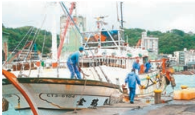
漁船「金瑞益88號」前晚遭大浪襲擊翻覆。圖為與該船同船隊、同型號船隻。網上圖片

反同婚團體也同時佈局「公投」連署，希望「立法院」停止審議「同婚法案」，將改變台灣家庭價值的重大「修法」，交付「公投」決定。挺同婚一方也不甘示弱，11月起陸續發起的各界連署，目前已有50多個專業領域發起，其中包括警察、教師、社會工作者等都從各自領域提出觀點。