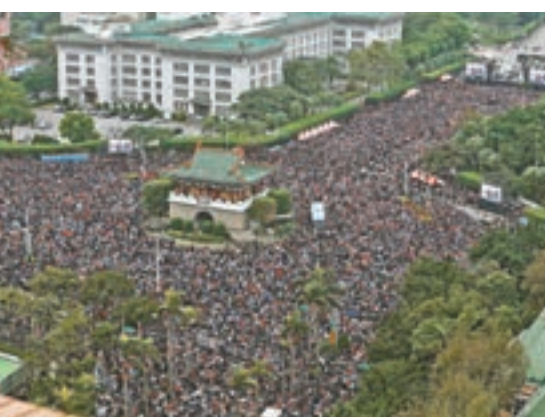
「讓生命不再逝去，為婚姻平權站出來」音樂會昨日在凱達格蘭大道舉行。