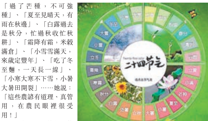
二十四節氣圖。

我姐姐曾是下鄉知青，還當過幾年知青隊長，他曾經向老農學過二十四節氣等方面知識，爛熟於心，至今仍經常冒出「立春一日，水暖三分」、「雷打立春節，驚蟄雨不歇」、「驚蟄過，暖和平，蛤蟆老角唱山歌」、「春分甲子雨綿綿，夏至甲子火燒天」、「春分有雨家室忙，先種瓜豆後插秧」、「植樹造林，莫過清明」、「穀雨前後，種瓜種豆」、