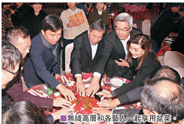
無線高層和各藝人一起享用盆菜。