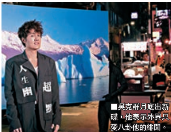
吳克群月底出新碟，他表示外界只愛八卦他的緋聞。

香港文匯報訊 等待超過一年，吳克群再次驚艷所有人，他進化為「人生觀察家」赤裸裸地揭開現實生活中的荒謬，將於本月30日推出全新專輯《人生超幽默》。吳克群不但以獨特觀點將所見所聞寫進歌裡，用反諷口吻將看似美好的假象道破，他無奈笑說：「這世界就是這麼殘酷又現實，就像我音樂做得再努力，但大家還是比較關心我的緋聞啊！」