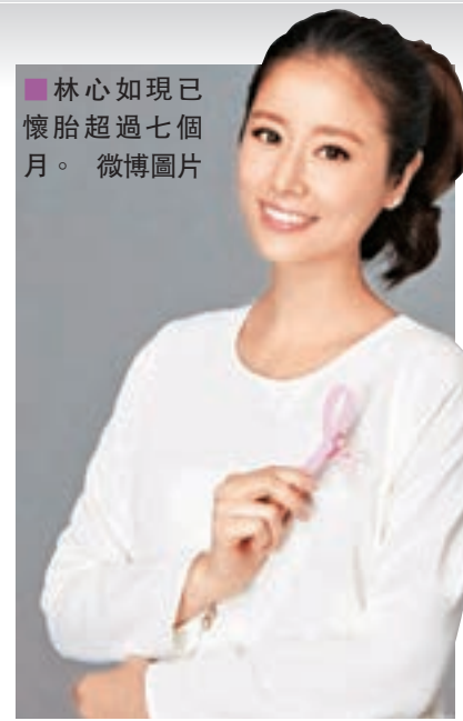
林心如現已懷胎超過七個月。