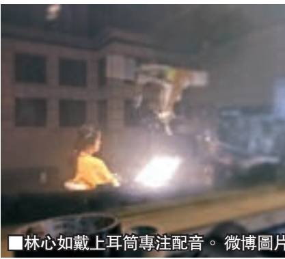
林心如戴上耳筒專注配音。

表示「這意思我們都懂，專心養寶寶，我們等妳回來」，亦有人稱「要照顧好自己和寶寶喔」，可見心如很得支持者的歡心。