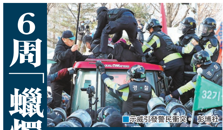
示威引發警民衝突。