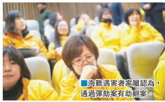
海難遇害者家屬認為，通過彈劾案有助翻案。