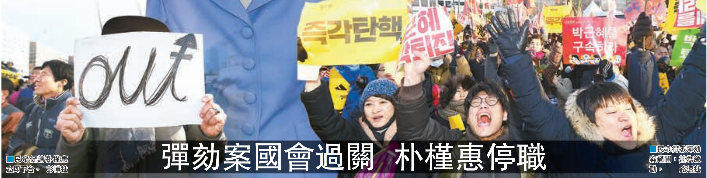
民衆促請朴槿惠立即下台。