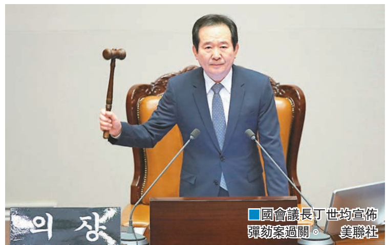
國會議長丁世均宣佈彈劾案過關。