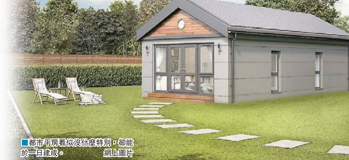
■都市平房看似沒什麼特別，卻能於一日建成。

這種模組式平房由英國廠商Willerby Innovations設計，所有工序都在工廠完成，平均每日可建造一間新屋。平房並非偷工減料，它符合英國政府可持續房屋第4級要求，至少可使用60年。兩房平房設有客廳、開放式廚房及廁所，另設售價5.5萬英鎊(約53.9萬港元)