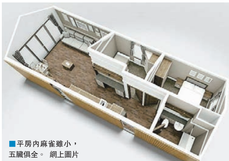
■平房內麻雀雖小，五臟俱全。

英國正面臨嚴峻房屋短缺危機，當局打算在2020年前興建100萬間房屋應付龐大需求。有建築公司設計出嶄新的「都市平房」，只需1日就能建成，讓住客即日入住。除效率極高外，售價亦相對大眾化，兩房平房只需6萬英鎊(約58.8萬港元)，價錢已包括運輸及建造費。