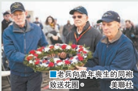
■老兵向當年喪生的同袍致送花圈。

前日是日本偷襲珍珠港75周年，在夏威夷珍珠港及美國各地均有紀念活動，其中珍珠港的儀式有數千人出席。在當年日軍戰機開始襲擊的一刻，美軍「哈爾西」號驅逐艦率先鳴笛，所有人低頭默哀，隨後F22戰機就在上空飛過，向偷襲珍珠港中2,300多名陣亡官兵致敬。