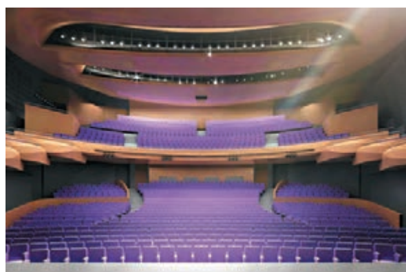
東九文化中心竣工後的構想圖內部。

林鄭月娥表示，當年多名來自不同政治背景的區議員，均同意爭取興建東九文化中心，顯示只要大家以地區居民福祉為依歸，不同政治背景的議員是可以齊心做事的，也代表政府、區議會以及地區人士可按着最大的公眾利益互諒互讓，達至共識。 她又說，東九文化中心是繼西九文化區後另一項特區政府投資的重要文化設施，有助鞏固香港作為國際文化藝術之都的地位，亦為本港文化藝術人才提供培訓和演出的場地，未來該中心與西九文化區的設施將成為兩個重要的文化地標。她續說，中心毗鄰九龍灣和觀塘商貿區以及啟德發展區，能為建設九龍東成為本港第二個核心商業區增值，令九龍東成為擁有大型住宅建設、甲級商業中心，以及高質素文化設施的非一般核心商業區。