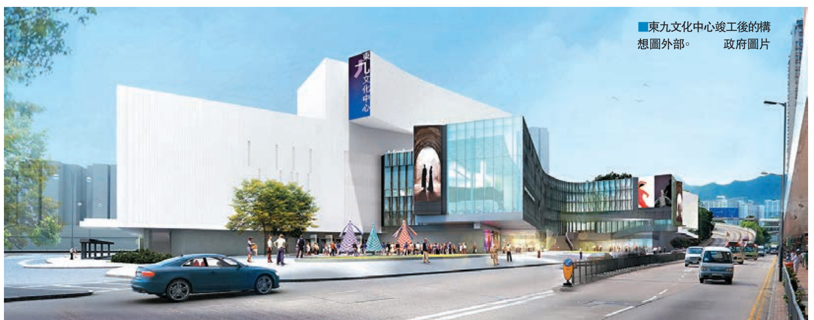
東九文化中心竣工後的構想圖外部。

香港文匯報訊（記者 鄺慧敏）為增加表演場地，香港特區政府於九龍灣牛頭角下邨原址興建東九文化中心，內有5個室內演藝設施，並設有公眾休憩用地，料於2020年竣工、2021年年底啓用。中心設計亦加入環保元素，如設有太陽能板、雨水收集器等，綠化空間共佔30%。政務司司長林鄭月娥昨日在中心奠基典禮上致辭時表示，東九文化中心對香港有雙重意義，是繼西九文化區後另一項特區政府投資的重要文化設施，有助鞏固香港作為國際文化藝術之都的地位。