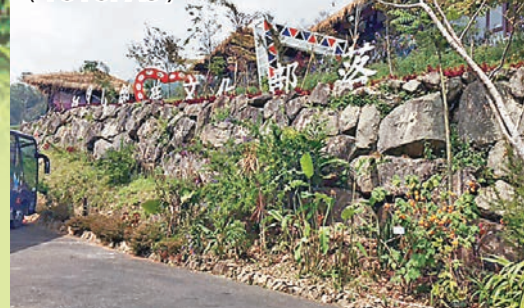
記者走進了鄒族文化部落——優遊吧斯（YUYUPAS）。

經過一番激烈的討論後仍無結論，部分族人為發洩憤懣情緒，遂抽出身上的配刀，向枯木砍去以發洩情緒。族人接二連三砍枯木，無意間就把枯木砍成陽具狀而未察覺。隔日，女神照例打掃，女神從遠處看到此一陽具狀枯木，心裡以為是另一神躺在那裡，此時女神心裡羞怯而離開，從此該處不再有山崩，族人於是領悟了女神羞於見到此物，往後只要有山崩現象，族人就會立此木柱鎮壓女神。鄭信得笑着，得悉這個傳說的遊人看見這塊「鎮山之寶」時，不會覺得怕羞，反而