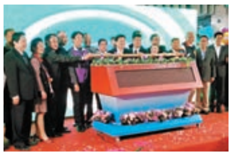
香港—花蓮直航首航啟動儀式。

為慶祝香港—花蓮新航線首航，HK Express 特別推出優惠促銷，剛推出的震撼優惠，香港至花蓮航線單程只需HK$96起，預訂日期今晚（12月8日23:59）止，旅行日期適用於2017年1月1日至11月30日。