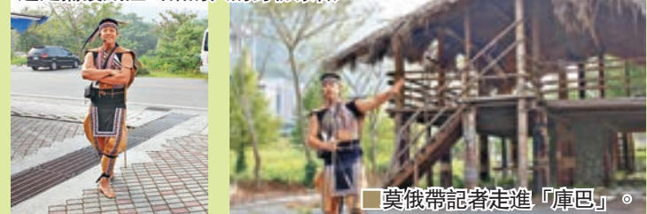
莫俄帶記者走進「庫巴」。