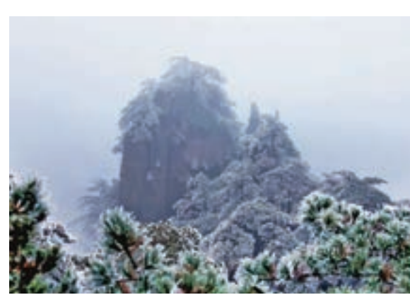
雪後黃山美如畫 ■在安徽黃山風景區拍攝的雪景。