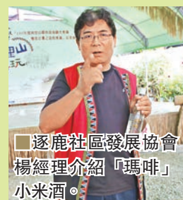
勇士們會與長老坐在火爐前一同喝小米酒說故事。