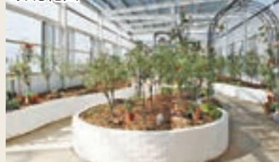
飲山郁茶茶&玫瑰花園內藏着一個玫瑰花園。

此外，記者亦前往飲山郁茶茶&玫瑰花園品茶，鄰近的生力農場群山環繞美麗的茶裏王茶園，場面壯觀！甫踏進飲山郁茶茶&玫瑰花園，即聞到陣陣花香，原來店內藏着一個玫瑰花園，園內所種植的玫瑰花都是可食用的，老闆娘表示他們利用了玫瑰花結合烏龍茶，讓烏龍茶吸收玫瑰花香後，再將玫瑰花取出，使烏龍茶更添香氣。