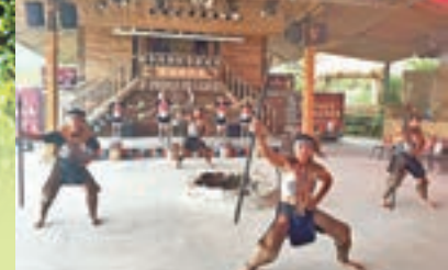
茅達諾劇場演出勇士舞。

信得指這塊是「鎮山之寶」，並道出其典故：相傳曾有一位女神NIVNU掌管山林，喜歡帶着掃把打掃部落周圍的山林環境，但因力量過大，常常把一座山掃動到山崩，毀壞部落，於是族人開會討論如何告知女神，正巧會議地點豎立一根枯木。