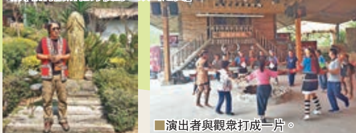
演出者與觀眾打成一片。