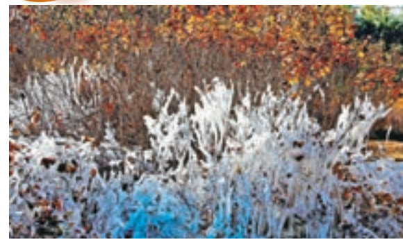
冰封樹掛 晶瑩如畫 ■在甘肅張掖黑河濕地，晶瑩的冰掛掛滿枝頭。