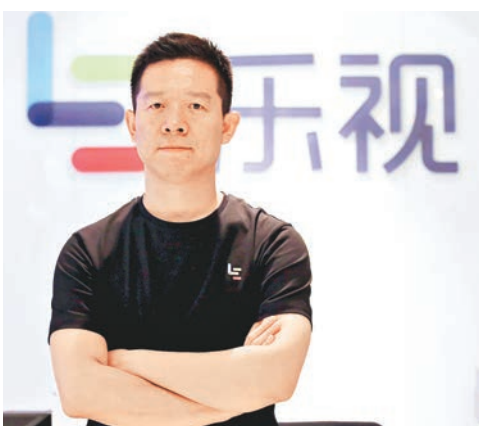
賈躍亭昨在微博回應有關樂視網股權質押事件。

香港文匯報訊(記者 章蘿蘭 上海報道)樂視風波不斷，昨天又有消息稱樂視創始人兼董事長賈躍亭有一筆樂視網股權質押，周