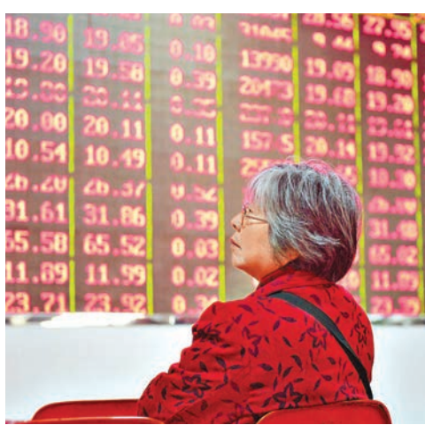
滬綜指昨重上3,200點關口。

方正證券首席經濟學家任澤平指出，大類資產的投資機會，正在從房市、債市到股市、商品轉變。在他看來，經濟L型軟着陆、溫和通脹，有利於企業盈利繼續改善，對股票和商品比較有利。