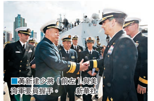
■高新建少將(前左)與美海軍要員握手。新華社

香港文匯報訊 據新華社報道，中國海軍艦艇編隊6日抵達美國西南部港口城市聖迭戈，開始對美進行為期4天的正式友好訪問。這是美國大選後，中國軍隊首次到訪美國。