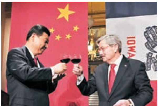
■2012年習近平到訪艾奧瓦州時，布蘭斯塔德設晚宴招待。

香港文匯報訊 綜合BBC及外交部網站報道，美國候任總統特朗普將任命艾奧瓦州州長布蘭斯塔德出任美國駐華大使，而他與中國國家主席習近平相識逾三十年。中國外交部發言人陸慷昨日回應詢問時，形容布蘭斯塔德是「中國人民的老朋友」，歡迎他為促進中美關係發展發揮更大作用。