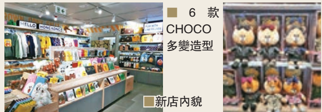
6款 CHOCO 多變造型