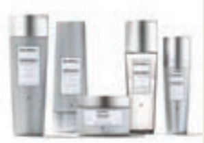
■ Kerasilk 絲蛋白水刺系列

系列蘊含微細角蛋白分子，能深入修護髮芯養分，深層滋養、修補及重建疲弱髮絲。另一成分之護色絲蛋白，有助減少水分帶走髮色的機會。特別加入廣受大眾認同的星級成分——Hyaloveil 陽離子透明質酸，有效修護髮絲角質層，阻隔養分流失，使秀髮持續滋養水潤。要保持身體健康，必須每天補充足夠水分；要維持頭髮健康，便為頭髮鎖緊水分，讓亮澤髮絲依然。