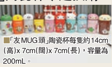
「友MUG頭」陶瓷杯每隻約14cm(高)x7cm(闊)x7cm(長)，容量為200mL。

今天，7-Eleven 推出 LINE FRIENDS × Sanrio characters 「友MUG頭」陶瓷杯系列，成為 LINE FRIENDS 及 Sanrio characters 於香港史前無例的跨界合作。其聯乘在香港首度登場，讓「三心兩意」的粉絲終於圓夢，這換購活動以「EAT · PLAY · LOVE」為主題，打頭陣第一浪為「PLAY」系列，由即日起至2017年1月24日，一套十隻「友MUG頭」陶瓷杯萌爆登場，憑20個印花即可免費隨機換購陶瓷杯一款，或以7個印花加HK$28隨機換購其中一款。「陶瓷MUG頭」以 LINE FRIENDS 及 Sanrio characters 肖像組成，並能與同為陶瓷製的杯身自由配搭，靈活度甚高。今個冬天，約齊朋友，集齊全套，為 OUR 1st MOMENTS 乾杯！Cheers！