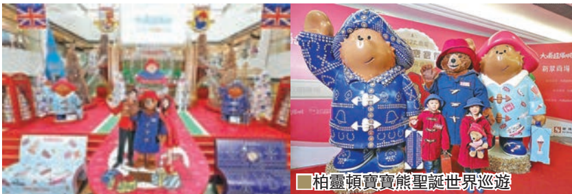
柏靈頓寶熊聖誕世界巡遊

今個聖誕，新鴻基地產（簡稱新地）旗下12個商場包括大埔超級城、新太陽廣場、元朗廣場及新翠商場等送上歐陸特色聖誕，強勢推出十大聖誕至激體驗，投放逾5,300萬元的聖誕宣傳推廣費及獎賞創歷年新高，並邀請到英倫人氣 Paddington Bear 柏靈頓寶熊與消費者互動，滿足「Selfie 族」愛社交分享的需要，既有大熱 VR 玩意，還有法式甜點快閃店等，務求以至激好玩體驗留住大家，齊齊激活本土消費。