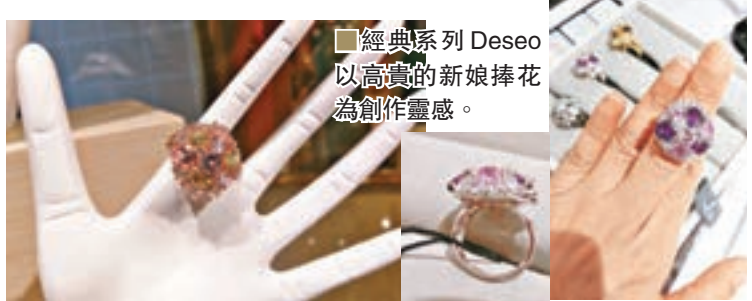
■ 經典系列 Deseco 以高貴的新娘捧花為創作靈感。

品牌於西班牙馬德里的工場，每位客人所完成的设计圖也會送到西班牙，工匠們將以百年工法，手工打造出全球唯一專屬的作品，而訂製的首飾將會在三個月後送到你和摯愛的手中，成為一份永遠無法被取代的禮物。